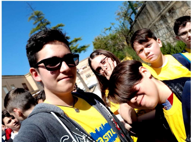
@ssardaru nu statea cu noi....